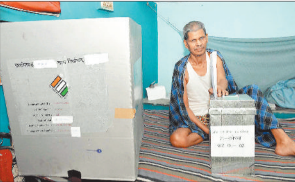
घर में मतदान करते दिव्यांग मतदाता।