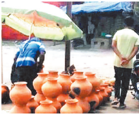
सड़क किनारे धूप में लमी मटके की दुकान।

झाड़ू, सहित सामग्री बेचने के लिए सड़क किनारे दुकान लगाते हैं। इन्हें उचित स्थान देने और दुकान लगाने के लिए नगर निगम ने शहर के बुधवारी बाजार के पार्किंग एरिया और मुड़ापार के दुर्गोत्सव मैदान में चबूतरा और शोड बनाया है। नगर निगम ने पौनी पसारी योगन अंतर्गत बिना प्लानिंग के बुधवारी और मुड़ापार बाजार में चबूतरा, शोड सहित अन्य