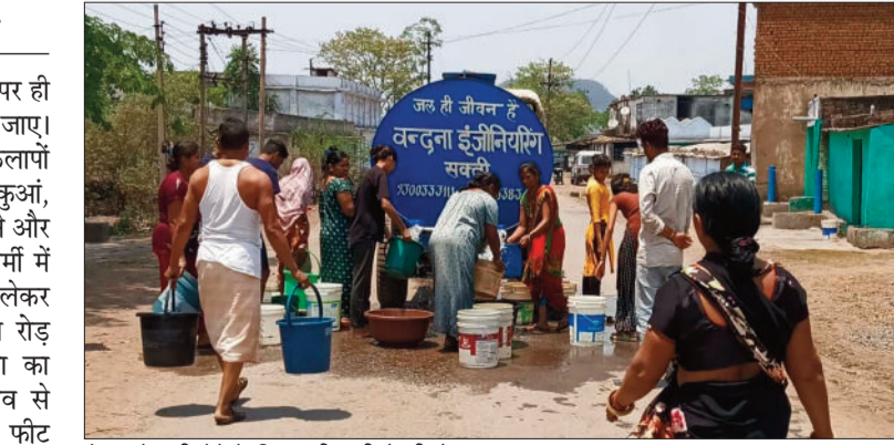
टैंकर से पानी लेने के लिए लगी ग्रामीणों की होड़।

भीषण गर्मी से निजात पाने लोग घरों पर ही रहना पसंद करते हैं, कहीं लू न लग जाए। लेकिन जब घर पर पीने, नित्य क्रियाकलापों के लिए पानी घर पर न हो, घर का कुआं, बोर इत्यादि सूख गए हैं। लोगों को पीने और नित्य क्रियाकलापों के लिए भीषण गर्मी में दोहर के 12 से 1 बजे टैंकर पानी लेकर पहुंचता है। यह घटना पुराने दीपका रोड़ मलगांव की है। इस गंभीर समस्या का जिम्मेदार दीपका कोयला खदान गांव से लगा है। जिसकी गहराई 300 से 700 फीट है। जहां पूरे क्षेत्र का पानी खदान ने खींच लिया है। वहीं खदानों में रोजाना हैवी ब्लास्टिंग होती है। हरदीबाजार क्षेत्र में कुआं,