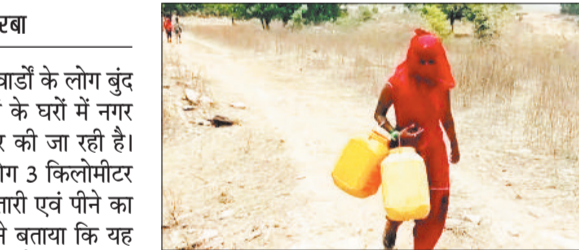
पानी लेने जाते ग्रामीण।

गर्मी के मौसम में नगर निगम के कई वार्डों के लोग बुंद बुंद पानी को लेकर परेशान हैं। लोगों के घरों में नगर निगम द्वारा पानी सप्लाई न के बराबर की जा रही है। देहानपारा, भद्रापारा, डुगुपारा के लोग 3 किलोमीटर पैदल कड़ी धुप में टेंगुनाला से निस्तारी एवं पीने का पानी लाने को मजबूर हैं। नागरिकों ने बताया कि यह समस्या काफी समय से यहां पर बनी हुई है। इसके लिए उन्होंने कई बार नगर निगम के अधिकारियों का ध्यान आकर्षित किया और आवश्यक प्रयास करने के लिए भी कहा लेकिन इसके कोई नतीजा नहीं आ सका। आखिरकार अब गर्मी सिर पर आने के साथ हर तरफ परेशानी पैदा कर रही है। खासकर बालकोनगर के इन क्षेत्रों में नागरिकों को पानी के लिए काफी मशक्कत करनी पड़ रही है। अधिकांश क्षेत्रों में जल स्तर नीचे चले जाने से समस्याएं पैदा हुई हैं और लोगों को काफी दूर से