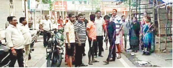
घटनास्थल पर जुटी लोगों की भीड़।