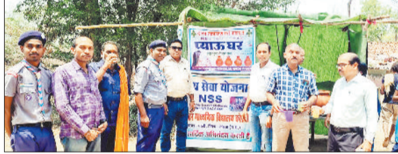
प्याऊ का शुभारंभ करते स्काउट गाइड्स।