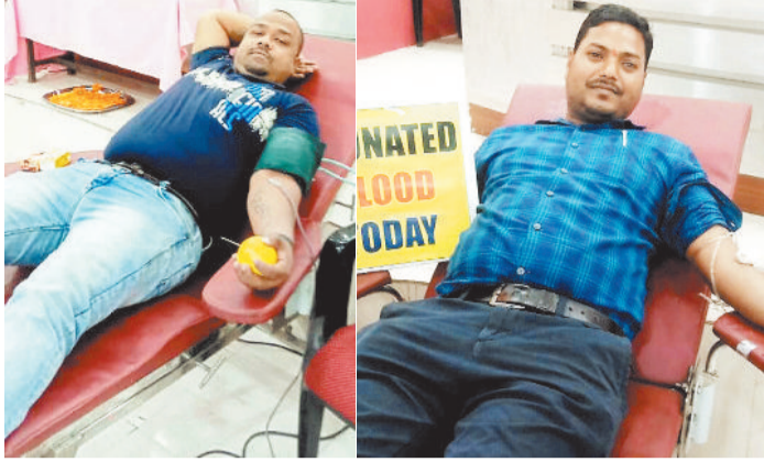
रक्तदान करते युवक।