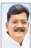
डॉ चरण दास महंत

हमें बाहरी बताने वाली सरोज पाण्डेय पहले यह बताएं कि कोरबा से उनका क्या रिश्ता है? उन्हें यह नहीं भूलना चाहिए कि कोरबा लोकसभा पूर्व में अविभाजित जांजगीर लोकसभा का हिस्सा हुआ करता था और उससे पृथक होकर कोरबा लोकसभा तथा कांग्रेस की प्रदेश सरकार में सकृती पृथक जिला का गठन हुआ है। अविभाजित जांजगीर लोकसभा के समय से मैं और मेरा पूरा परिवार क्षेत्रवासियों की सेवा करते आए हैं और कोरबा लोकसभा के जनता का स्नेह व आशीर्वाद हमेशा से रहा है। उक्त बातें छत्तीसगढ़ विधानसभा के नेता प्रतिपक्ष डॉ. चरणदास महंत ने भाजपा प्रत्याशी सुश्री सरोज पाण्डेय के द्वारा उन्हें सकृती का निवासी और बाहरी बताने के बयान पर पलटवार करते हुए कहा। डॉ. महंत ने कहा कि सरोज पाण्डेय अपना दुर्ग जिला छोड़कर कोरबा में चुनाव लड़ने आई हैं तो उन्हें यह पता है कि कोरबा लोकसभा से उनका